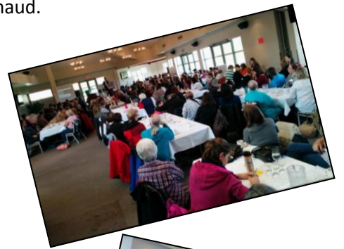
Table régionale des organismes communautaires de Lanaudière